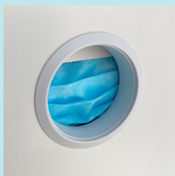
Spender für Mundschutzmasken