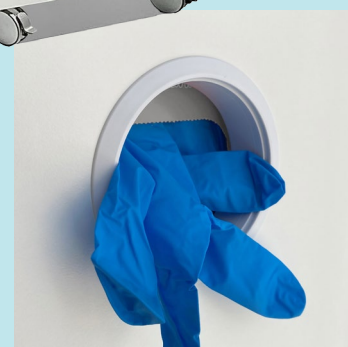
Spender für Einmalhandschuhe