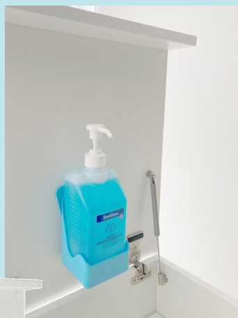
Halter für 1000 ml Sterillium Dosierspender

Die Spender werden mit einer Holzfeder fixiert. Die Tiefe ist durch seitliche Schlitzte variierbar.