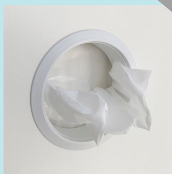
Spender für Kosmetiktücher